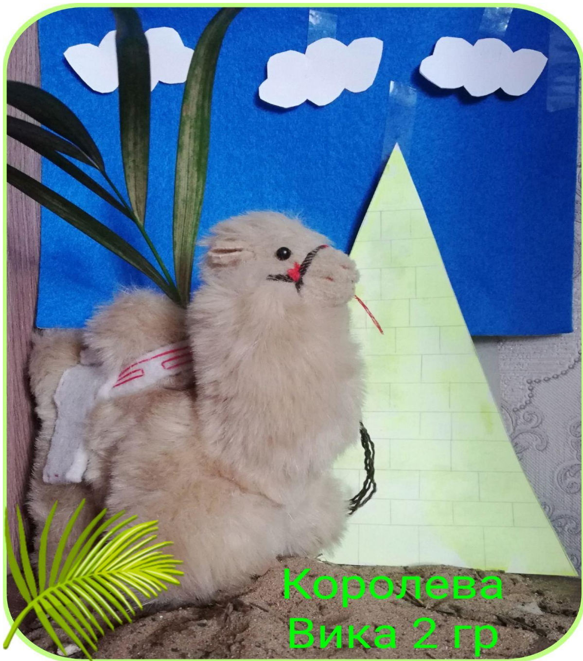
Королева Вика 2 гр